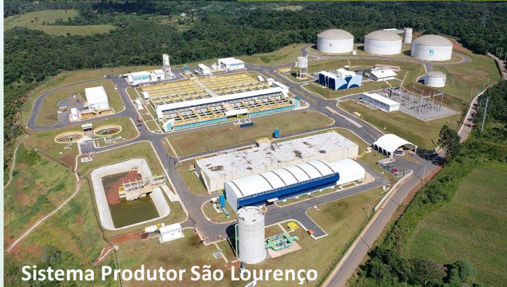
Sistema Produtor São Lourenço