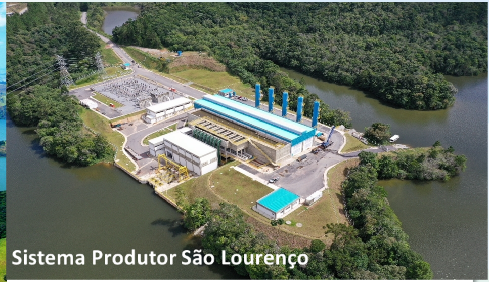
Sistema Produtor São Lourenço