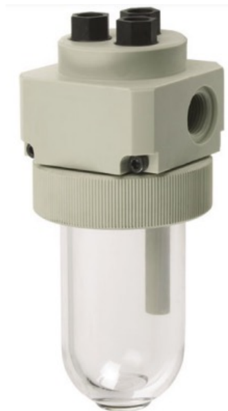
Sensor Íon seletivo para flúor