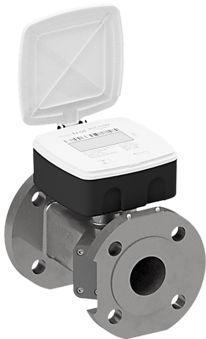
Medidor ultrassônico de volume de água