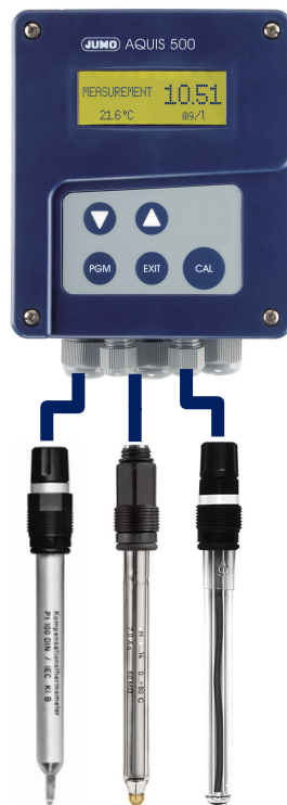
Analizador de flúor