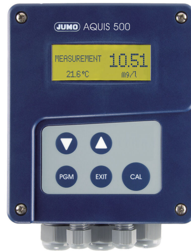
JUMO AQUIS 500 Flúor