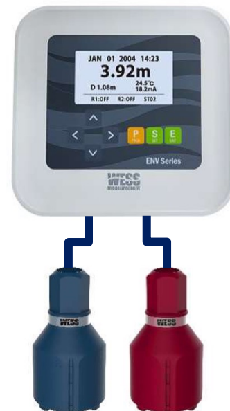
Medidor de manta de lodo