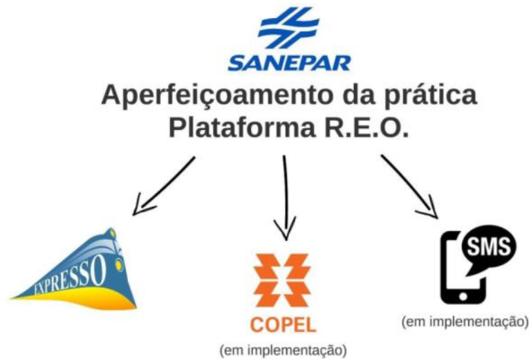
Figura 4 - Aperfeiçoamento da Prática da Plataforma REO