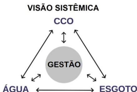
Figura 1 - Visão Sistêmica dos Processos sob Gestão da Unidade

A Plataforma REO constitui-se de um sistema digital, operado via Intranet, que objetiva agrupar todos os registros de ocorrências das Unidades operacionais desta Unidade, permitindo-se uma visão sistêmica dos processos (Figura 1) evitando-se assim a perda de informações, tanto pela ausência de registros quanto pela falta de critérios ou clareza nas informações registradas.