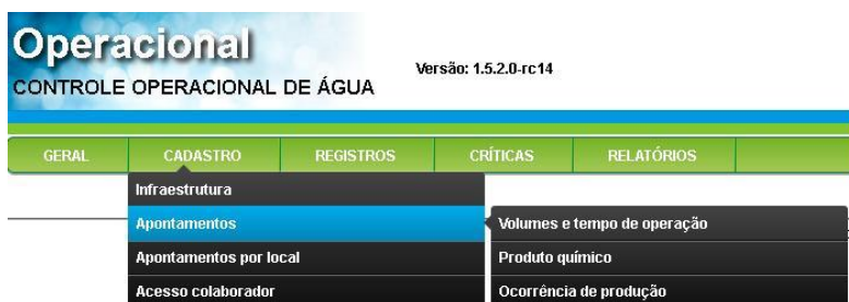
Figura 2: Sub-menu Apontamentos.

O Sub-menu Apontamentos é destinado para o cadastro de todos os volumes, produtos químicos e ocorrências utilizados como dados de controle operacional nos Sistemas de Abastecimento de Água da Cagece (Figura 2).