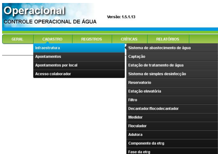
Figura 1: Sub-menu Infraestrutura.

O Sub-menu Infraestrutura (Figura 1) é destinado ao cadastro dos SAA e todas Unidades existentes neste desde a captação até a rede de distribuição de água. Para cada Unidade haverá o cadastro das suas informações específicas, localização, estado de conservação (bom, regular ou ruim) e situação (ativado ou desativado).