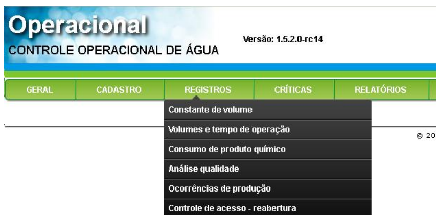
Figura 3: Menu Registros.

Menu dividido nos sub-menus: constante de volume, volumes, tempo de operação, consumo de produto químico, análise qualidade e ocorrências dos Sistemas de Abastecimento de Água (Figura 3). Esses registros são provenientes das informações preenchidas diariamente pelos operadores das Estações de Tratamento de Água e dos Sistemas de Simples Desinfecção através de Fichas de Registro COA.