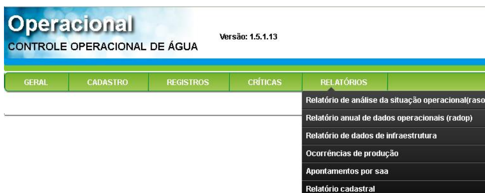
Figura 11: Sub-menu Relatórios.

Menu dividido nos sub-menus: Relatório de Análise da Situação Operacional (RASO), Relatório Cadastral, Relatório de Ocorrências Operacionais, Relatório Apontamento por SAA, Relatório de Anual de Dados Operacionais (RADOP) e Relatório de Dados de Infraestrutura (Figura 11).