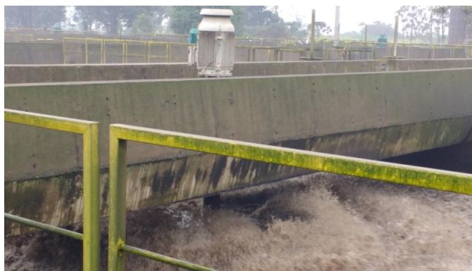
Figura 01 – Aerador Superficial do Tanque de Aeração

Os tanques de aeração necessitam de uma concentração de oxigênio dissolvida mínima para atender as necessidades do processo, para isso são utilizados diversos tipos de sistemas de aeração. No caso do local do teste e conforme já falado os equipamentos utilizados são aeradores superficiais (Figura 01) que atualmente já tem acionamento e controle através de inversores de frequência tradicionais. A escolha desses equipamentos foi justamente por já terem inversores de frequência tradicionais em pleno funcionamento.