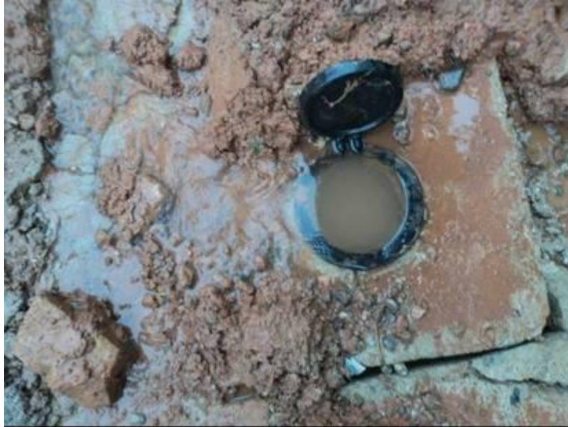
Figura 06 – Exemplo de Válvula de Bloqueio com vazamento na Gaxeta, aflorante.