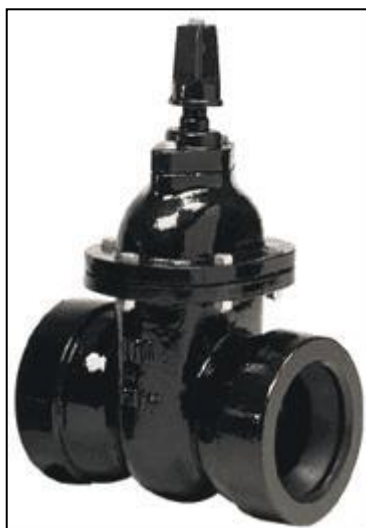
Figura 1: Exemplo de Válvula de Bloqueio do Tipo Gaveta

Normalmente nas Válvulas com diâmetros maiores, existem dispositivos de “By-Pass”, cuja finalidade é facilitar as operações de fechamento e abertura, constituídos de uma passagem à montante e à jusante do registro, cujo diâmetro é geralmente pequeno e, portanto, de fácil abertura ou fechamento.