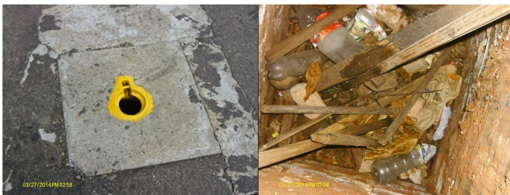
Figura 2: Exemplo de Válvula de Bloqueio Limítrofe e Resíduos encontrados

Muitos destas Válvulas, quando da manutenção e implantação destes setores limítrofes, recebem a pintura para sinalizar que sua operação pode acarretar problemas, porém o que se percebe e que apesar disso, a operação e falta de comunicação continuam a atrapalhar esta operação, com aberturas ou fechamentos inadequados dos mesmos. Além disso, como pode ser visto na figura 02 se não houver uma campanha de manutenção eficiente os locais já vistoriados se transformam em locais ineficientes para sua manobra, visto que seu caráter construtivo, onde apenas o "CAP" da haste do castelo, estão expostas em locais semienterrados e confinadas onde sujeiras e entulhos se acumulam.