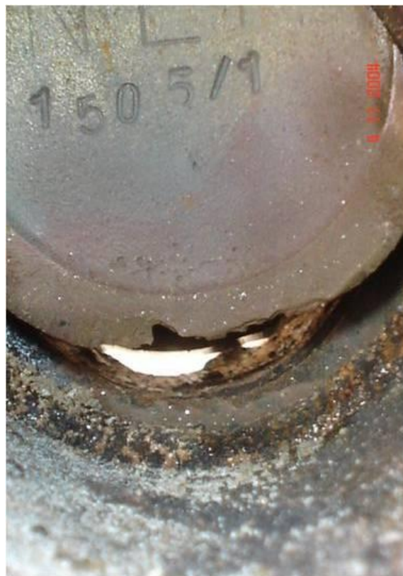
Figura 04 – Exemplo de Válvula de Bloqueio com Cela destruído pelo aumento da perda de carga e abrasão causada pela graduação da mesma.

Não podemos deixar de citar a má utilização na operação, seja pela cultura adquirida de “graduar” a válvula, o que aumenta a perda de carga e prejudica todo o sistema. A figura abaixo apresenta uma destas Válvulas, onde é possível verificar o desgaste no obturador e na sela, pelo efeito abrasivo e excesso de velocidade, causada pela “Válvula Graduada”, um dos grandes erros de operação em nossas redes de abastecimento.