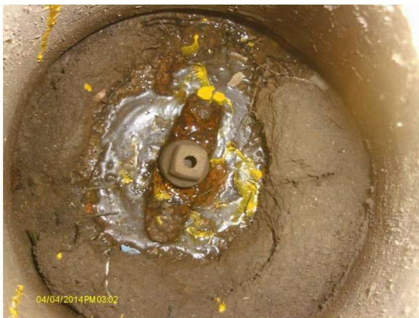
Figura 05 – Exemplo de Válvula de Bloqueio com vazamento na Gaxeta, não aflorante.