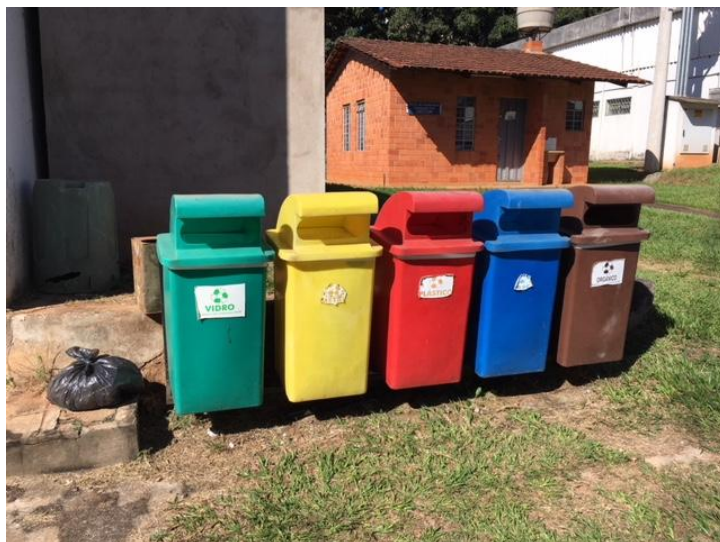
Figura 1: Conjunto de lixeiras para acondicionamento de recicláveis utilizadas nas EE.

A pesagem dos resíduos recicláveis gerados nas EE aconteceu no dia 21 de maio de 2018. Esse foi o dia escolhido para esta atividade, pois os resíduos depositados nas lixeiras para recicláveis são recolhidos pelo funcionário da empresa terceirizada responsável pela limpeza somente uma vez por semana, sempre nas segundas-feiras. Na área das EE existem sete conjuntos de lixeiras seletivas (Figura 1), cada um deles formado por recipientes específicos para o acondicionamento de vidros, metais, plásticos, papéis e orgânicos.