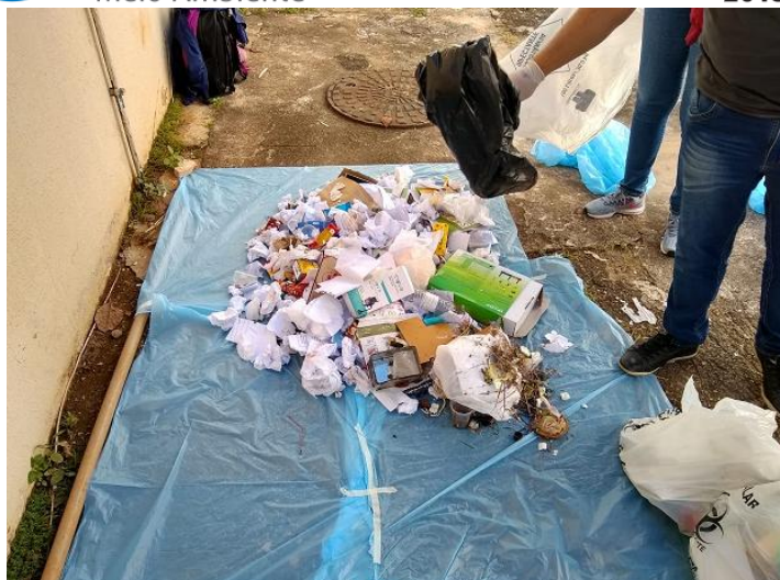
Figura 2: Abertura dos sacos plásticos para a determinação da composição gravimétrica.

Feito isso, o conteúdo foi separado em vidro, metal, plástico, papel, orgânico e outros. O objetivo deste procedimento foi avaliar se a indicação existente nas lixeiras era observada pelos geradores no momento do descarte.