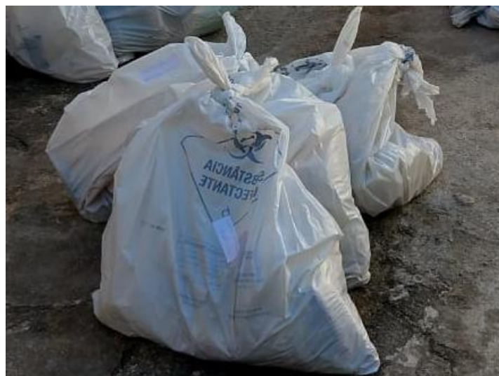
Figura 4: Acondicionamento de resíduos recicláveis em sacos brancos leitosos.

Outro fato que chama a atenção é a utilização inadequada de sacos brancos leitosos, identificados com o símbolo de substância infectante, nas lixeiras seletivas (Figura 4).