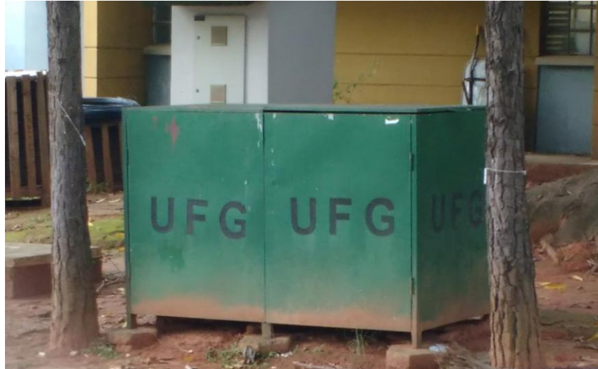
Figura 5: Contêiner reservado para a colocação dos resíduos recicláveis destinados à coleta seletiva.